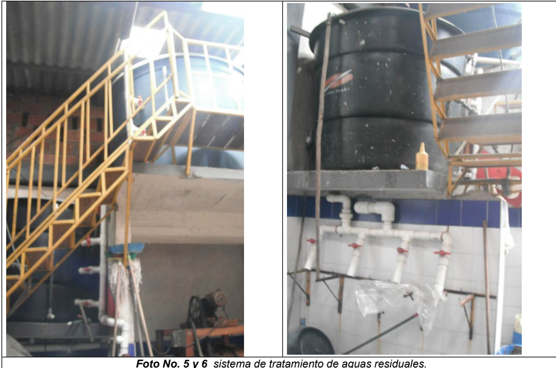
Foto No. 5 y 6 sistema de tratamiento de aguas residuales.

LA ACTIVIDAD REALIZADA POR EL USUARIO ES GENERADORAS DE ARnD..... SI NO CUERPO RECEPTOR DE LAS AGUAS RESIDUALES NO DOMÉSTICAS