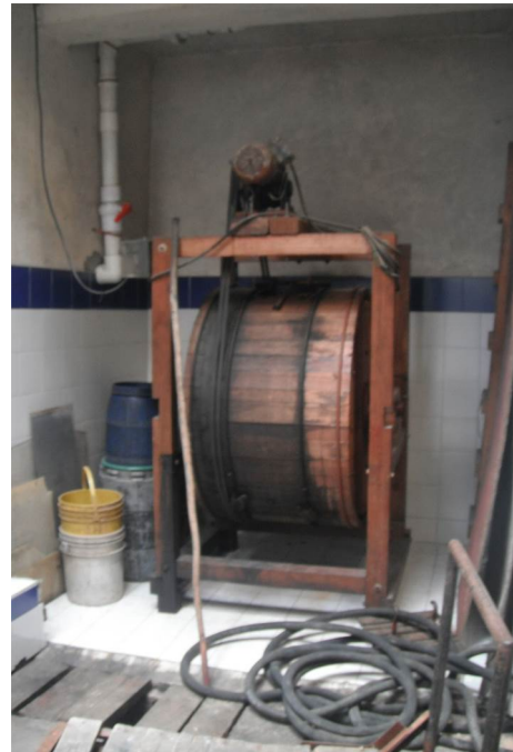
Foto No. 3 y 4 Bombos de proceso húmedo y paleteo de pieles