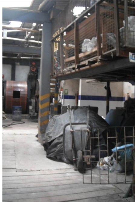
Foto No. 2 Proceso de curtación de pieles